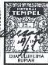
Photo dan tanda tangan yang berhak