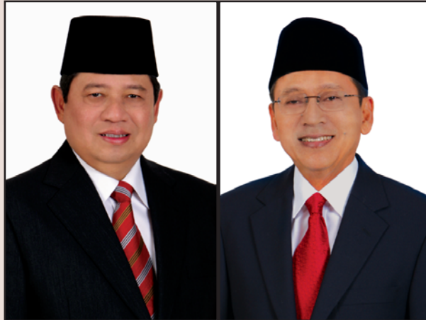
Dr. H. Susilo Bambang Yudhoyono Prof. Dr. Boediono