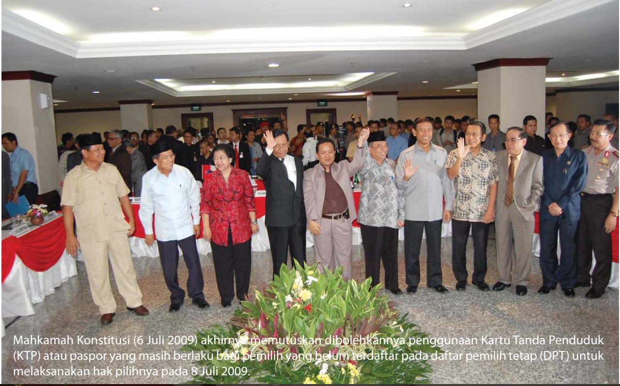
Mahkamah Konstitusi (6 Juli 2009) akhirnya memutuskan dibolehkannya penggunaan Kartu Tanda Penduduk (KTP) atau paspor yang masih berlaku bagi pemilih yang belum terdaftar pada daftar pemilih tetap (DPT) untuk melaksanakan hak pilihnya pada 8 Juli 2009.