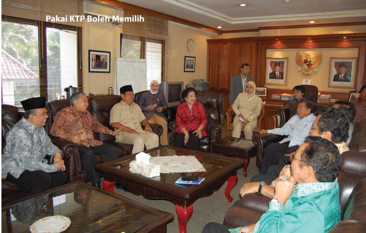
Suasana pertemuan antara KPU dan pasangan capres/cawapres yang membahas penggunaan KTP untuk memilih pada Pilpres 2009 di Gedung KPU, Jakarta, 6 Juli 2009.